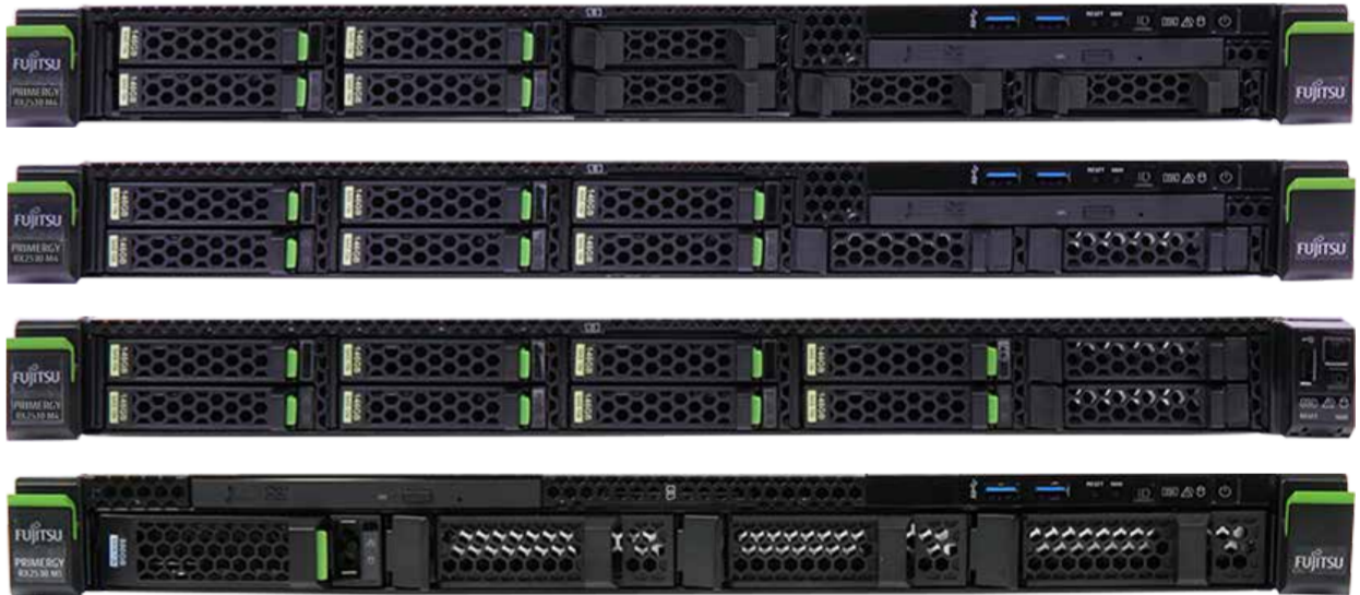
2.5 inch HDD module / 2,5 Zoll HDD-Modul / 2.5 インチ HDD モジュール

i The server can be operated with 4/8/10 2.5-inch hot-plug HDD/SSD modules or with up to four 3.5-inch hot-plug HDD modules. i Der Server kann mit 4/8/10 Hot-Plug-HDD/SSD-Modulen der Baugröße 2,5 Zoll oder mit bis zu vier Hot-Plug-HDD-Modulen der Baugröße 3,5 Zoll betrieben werden. i サーバは、最大 4/8/10 台の 2.5 インチホットプラグ HDD/SSD モジュール、または 4 台の 3.5 インチホットプラグ HDD モジュールを使用して運用できます。